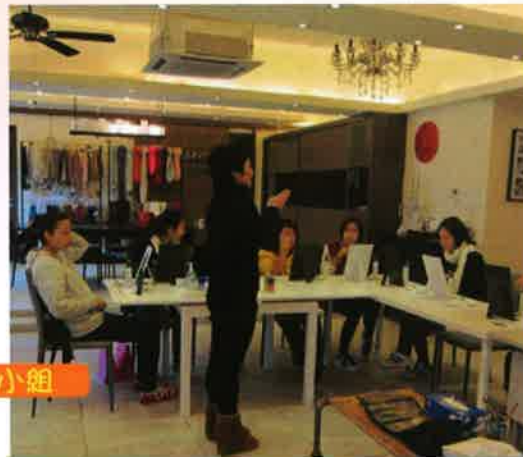
提升個人形象小組