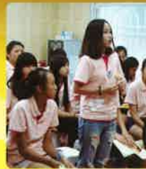
宿生勇敢分享個人的經歷