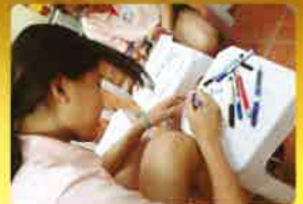
寫心意咭給路得學舍的舍友