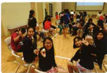
宿生在多功能中心活動

過去的一年，有賴修女們到各教堂為多功能中心的建築費進行募捐，在眾多恩人的慷慨支持及已離院的宿生積極協助下，多功能中心終於2015年12月竣工，並於2015年12月26日舉行祝聖禮及兒童村的開放日，除了不少關愛及支持兒童村的恩人外，不同年代的舊生也回院聚舊，共同見證兒童村服務的發展及環境的改善，令整個兒童村園地充滿喜悅及感恩的氣氛。