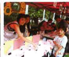
仁愛家少年嘉年華攤位