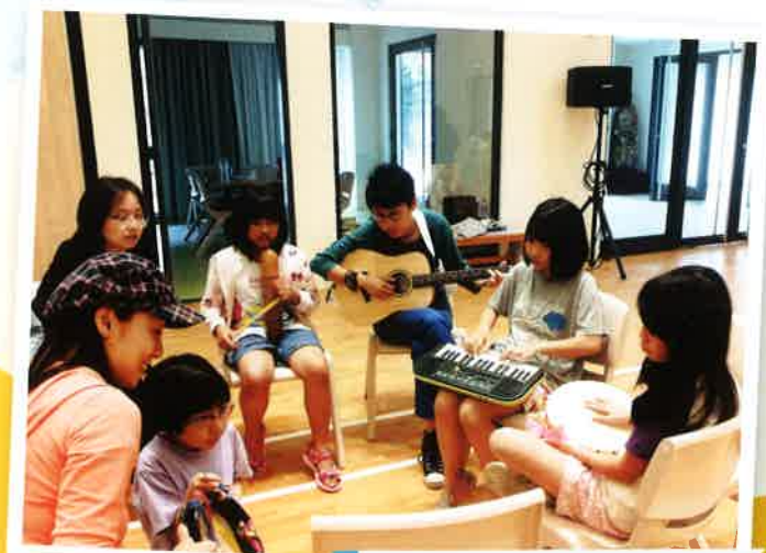
宿生在義工陪伴下學習配樂