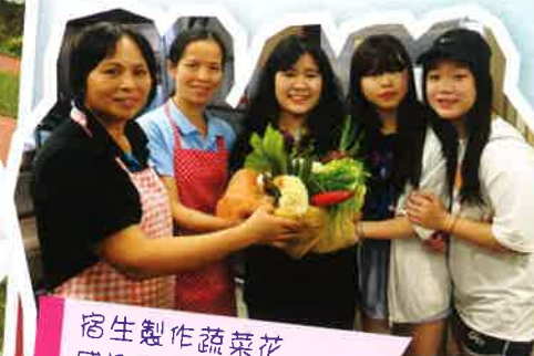
宿生製作蔬菜花 感謝兒童村互友的服務