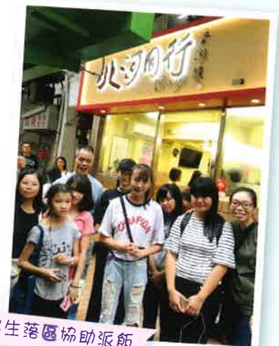
宿生落區協助派飯

本年度的年度計劃主題為「愛他人」，目的是鼓勵宿生學習走出家舍、走出兒童村去服務社區及關心其他人。在9月新學年開始時，職員在感恩祈禱暨祝福院舍禮儀中，透過濯足禮，表達以謙虛的心懷去服務宿生，為宿生立下服務別人的好榜樣。宿生在不同的義工服務經驗中得到不少啟發，特別是明白社會上有不少生活貧困及有需要幫助的人，懂得珍惜現在所擁有。