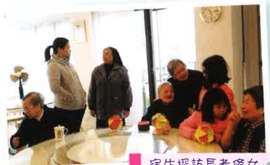
宿生探訪長者修女