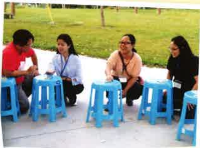
在教育體驗場經驗學習樂

團隊建立為每間機構均很重要，為院舍服務而言，前線的家舍職員與宿生的緊密接觸，情緒上很易彼此牽動，工作壓力亦隨之增加。因此，本年度機構舉辦了多次培訓工作坊，有動有靜，有為個人身心靈的成長，有的是為團隊建立，而家舍職員的台灣交流更是最寶貴的學習經驗，她們每人都帶着滿滿的熱忱回來。