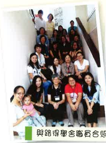
與路得學舍職員合照