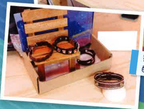
宿生義賣自己的製成品