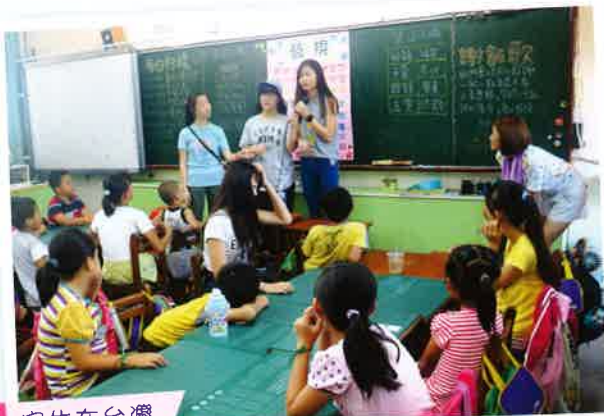
宿生在台灣服務小學生